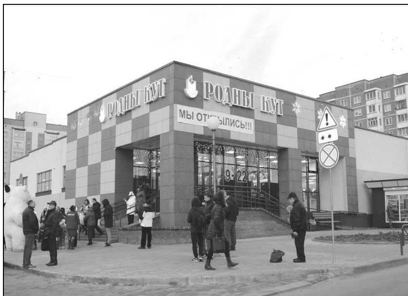
Рисунок Н.3 – Внешний вид магазина универсама «Родны кут» Гродненского городского филиала Гродненского областного потребительского общества